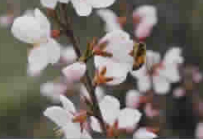
甜蜜之时(摄影) 凌毅力(土木学院)

二十年江山, 终是一堆臃肿 以骨为杆,敲击高原 一些风,匆匆赶来 磷火再燃, 我高出高原五尺