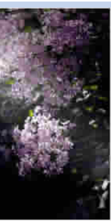
繁花如梦

不可抑制地怀念家乡的秋。满山遍野的秋色,一阵风过处,叶子纷纷扬扬,满地堆积。小时候,经常去采摘那些不知名的野果,兜里塞得鼓鼓的,攀爬那陡峭的土崖壁,乐而忘归,直到暮色四合才跑回家。山里的花儿草儿,多半有着可爱而奇怪的名字,在祖母口中呢喃,像一个遥远的传说,如今想起,暖意便从心底泛起。