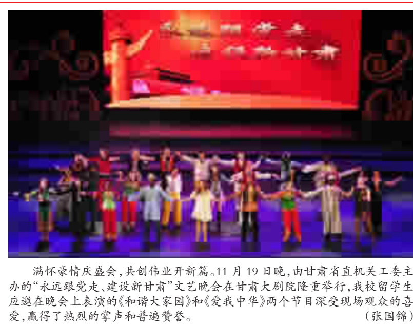
满怀豪情庆盛会,共创伟业开新篇。11月19日晚,由甘肃省直机关工委主办的“永远跟党走、建设新甘肃”文艺晚会在甘肃大剧院隆重举行,我校留学生应邀在晚会上表演的《和谐家园》和《爱我中华》两个节目深受现场观众的喜爱,赢得了热烈的掌声和普遍赞誉。(张国锦)

按照中央的要求和省委的部署,把学习十八大精神与学习十八届一中全会精神结合起来,把学习胡锦涛同志的报告与学习习近平总书记的重要讲话结合起来,在全省迅速兴起学习十八大精神、宣传十八大精神、贯彻十八大精神的热潮,使十八大精神真正成为全校广大党员干部和师生所掌握,认真抓好各项工作任务落实,加快推进建设高水平教学研究型大学的进程。 马军党副校长就我校学习贯彻落实党的十八大精神作了安排部署。他指出,我校学习贯彻落实党的十八大精神,要着力抓好七个方面的工作,即加强领导、精心组织,周密部署;继续营造浓厚的舆论宣传氛围;抓好中心组理论学习;抓好党员干部的学习;抓好教职工的学习;抓好广大学生的学